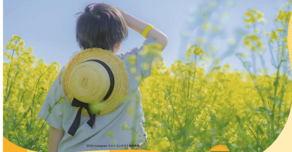
2024 Instagram フォトコンテスト優秀賞